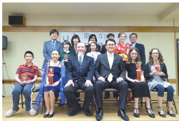
第45回小学生日本語お話大会

カテゴリー2 (家庭で日本語を話す小学生1年生～3年生)、カテゴリー3 (家庭で日本語を話さない小学生4年生～)、カテゴリー4 (家庭で日本語を話す小学生4年生～)と4分類、各カテゴリー定員10名、全体で最大40名とし、各発表者のお話の制限時間は2分でした。日本語をヘリテージ・ランゲージ (継承言語) としてご家庭でご使用のお子さん、日本語を外国語として学校で学んでいるお子さん、いずれにしても、第二言語でスピーチをすることはたいへん勇気のいることで、人前でスピーチをするとなると、その困難さはいっそうのことです。それにもかかわらず、とても素晴らしい出来映えでした。学校やご家族をはじめ、約130名の方々の応援でとても盛会となりました。本大会に出場するために練習を積んできた出場者の皆さん一人ひとりの健闘を讃えたいと思います。また、審査は、日系地域社会で活躍しているリーダー、日本語の普及に従事している地域の日本語教師に依頼し、入賞者を選出しました。入賞者には賞状と賞品そしてトロフィーを授与、参加者にも賞状、参加賞、そしてトロフィーを授与することで、入賞者と遜色のないようにし、教育的にも配慮しました。出場者や審査員、ご協力いただきました関係者の方々に心より御礼申し上げます。なお、今回の結果は事頁の通りです。