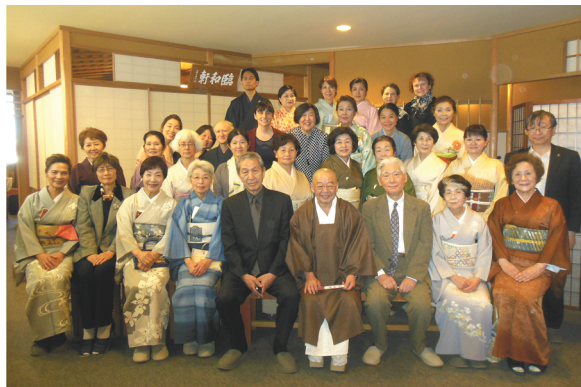
第4回お茶三昧会議