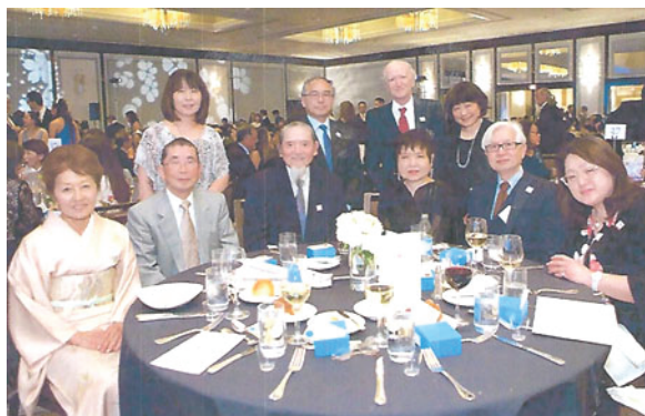
サンフランシスコ日本町桜祭り50周年記念晩餐会