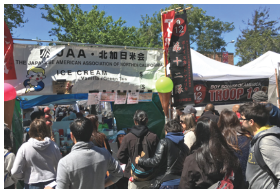
みたらし団子完売の大盛況