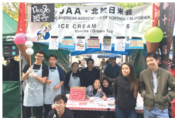
ワシントン高校の学生達と

売上金の一部をワシントン高校の学生達への感謝の気持ちと彼らが来年夏休みに東日本大震災のボランティアへ行くための援助金として寄贈させて頂きました。ご協力頂いた日米会の理事の方々、ワシントン高校の生徒達とその保護者の方々、本当にありがとうございました。(森川知計)