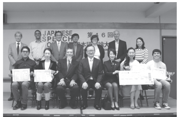
大学・成人の部 The College Student and Adult Division